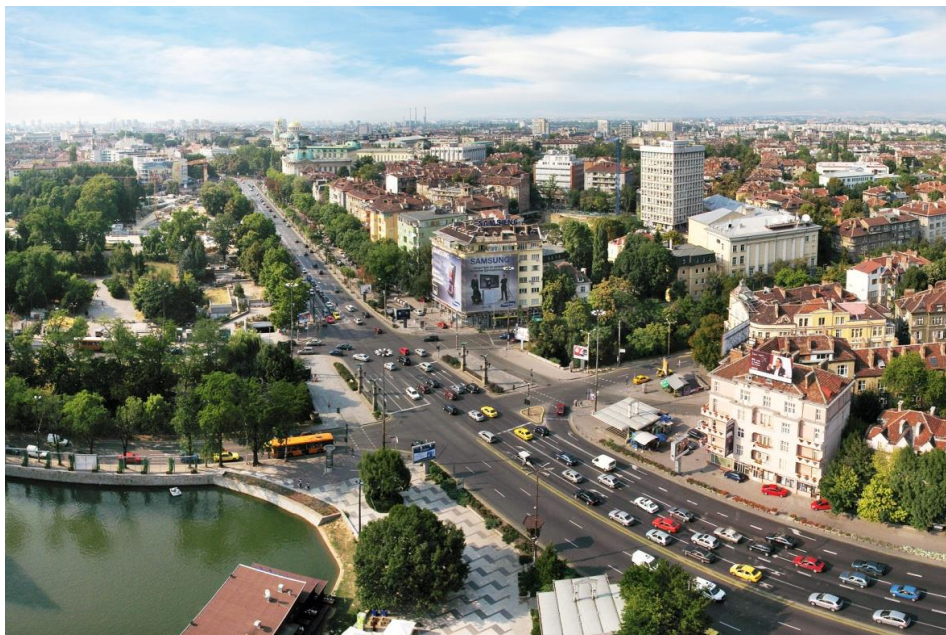
Sofia - stolica Bułgarii