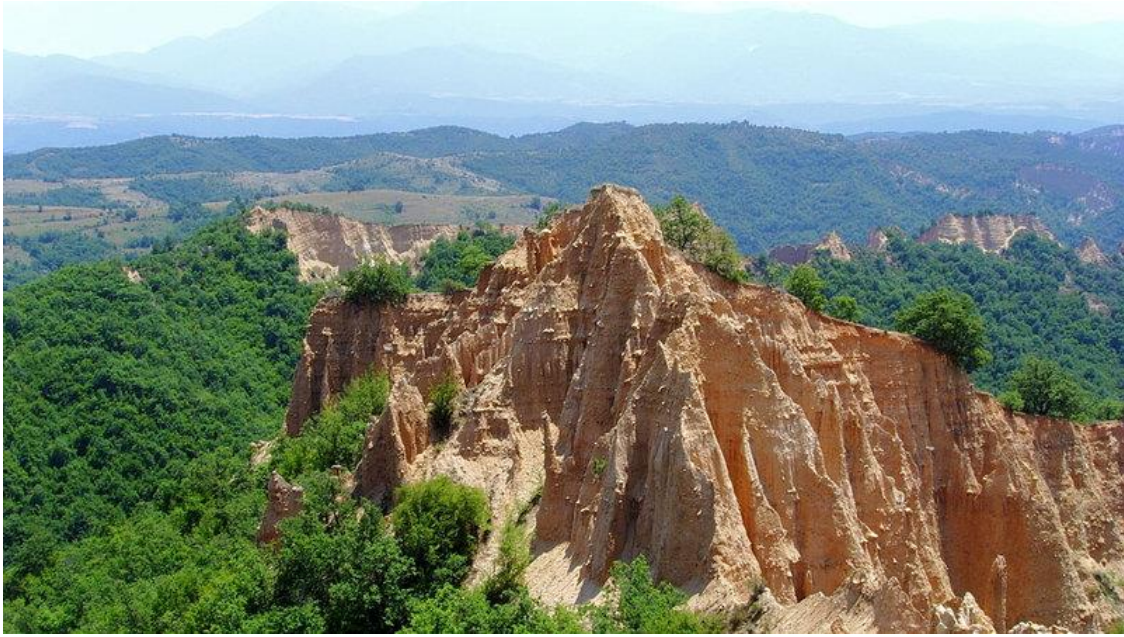
Rifta - bułgarskie góry