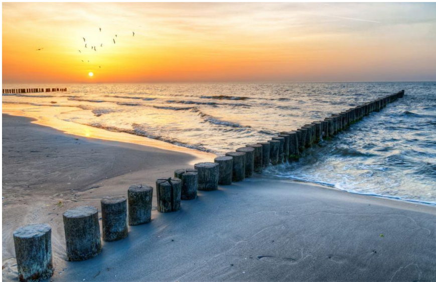
Polska - Morze Bałtyckie