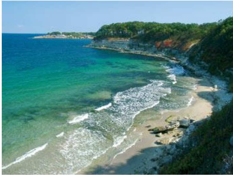
Bułgaria – Morze Czarne