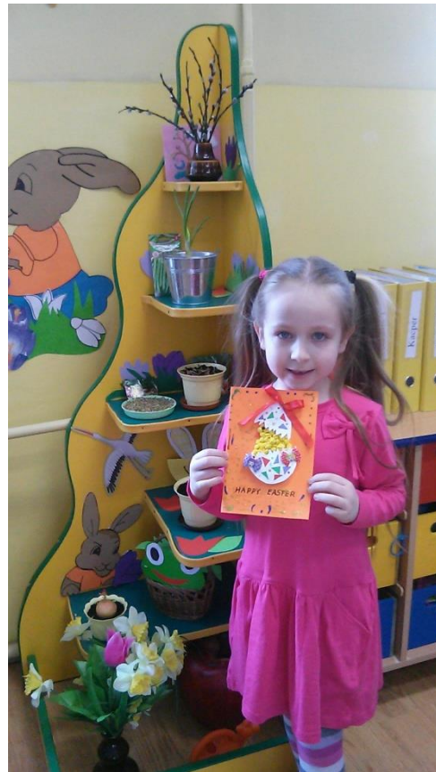
Kartki świąteczne wykonane przez dzieci z grupy „Żabki” dla bułgarskich kolegów.