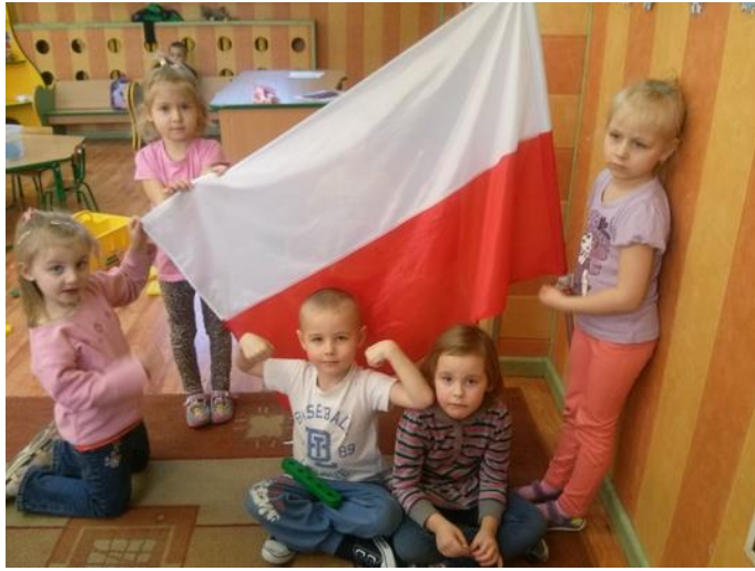
Starsze dzieci z grupy „Słoneczka”.