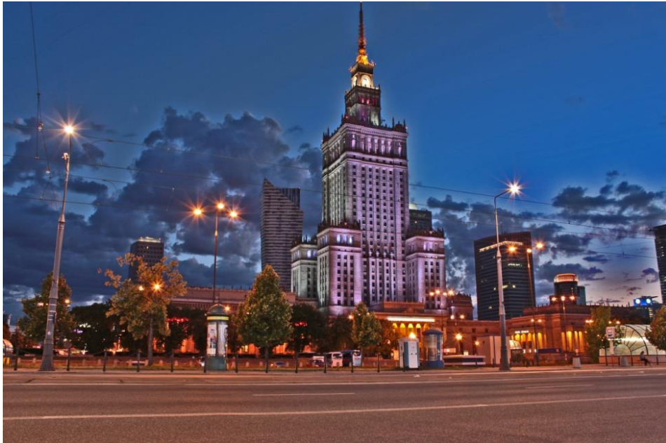
Warszawa - stolica Polski.