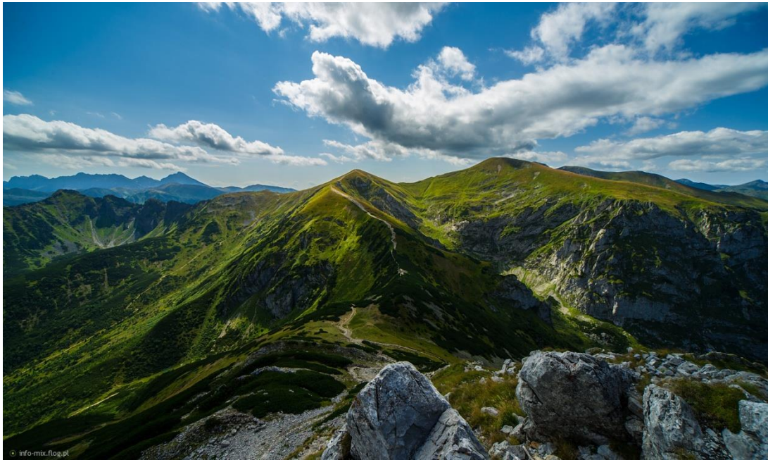
Tatry – polskie góry